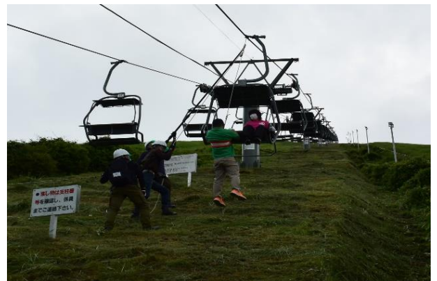
救助訓練・予備原動機救助訓練