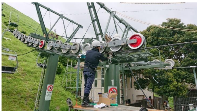
1号柱索輪交換作業