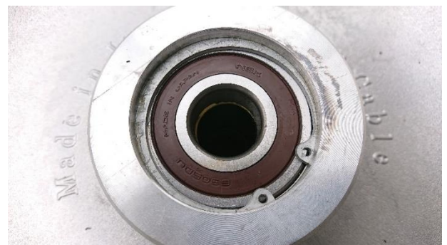
新ベアリング圧入後