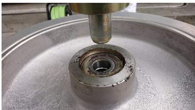
旧ベアリング抜き取り作業