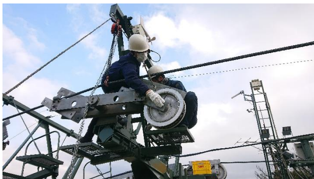
8号柱索輪交換作業