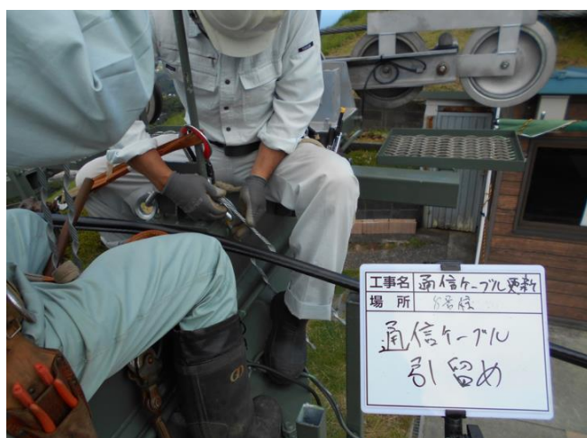
通信ケーブル更新